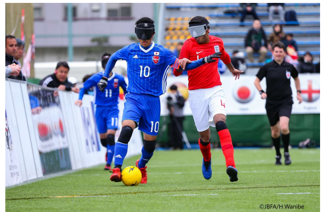
(株)品川ケーブルテレビプレスリリース